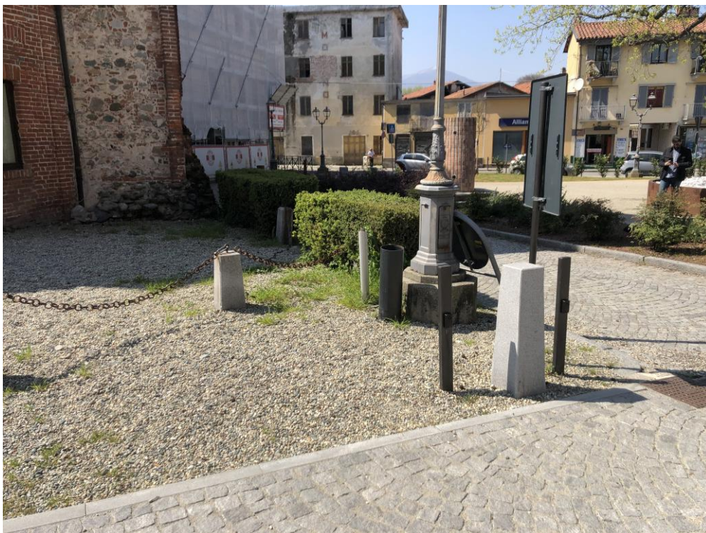
Foto n. 14. Dettaglio ingresso piazza