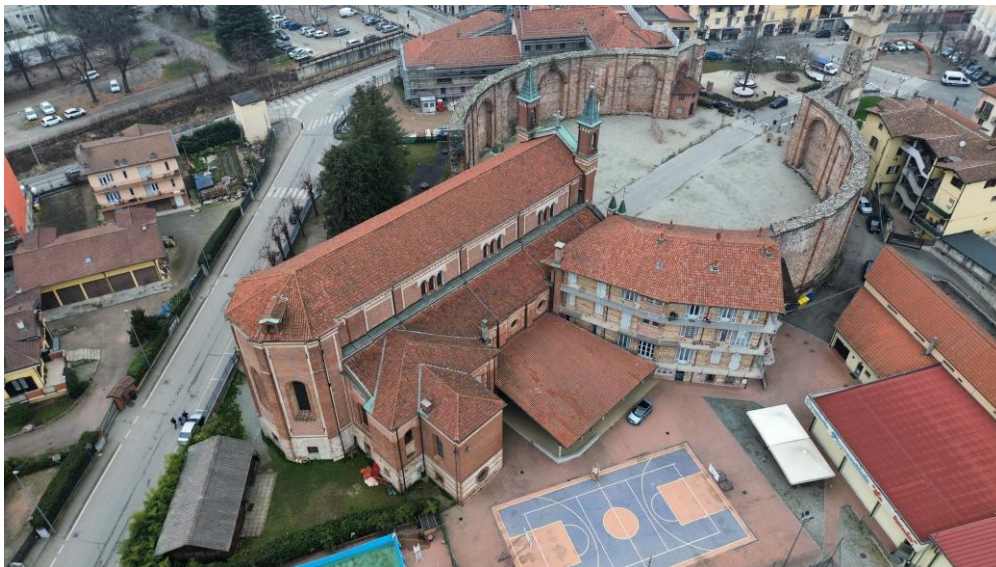
Foto n. 06. Vista aerea da sud est