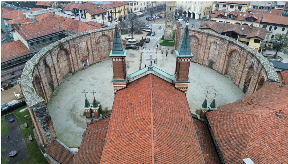
Foto n. 04. Vista aerea da sud