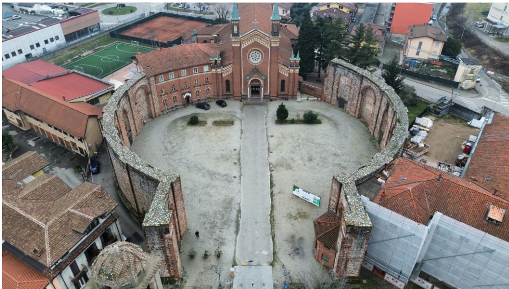
Foto n. 02. Vista aerea da nord