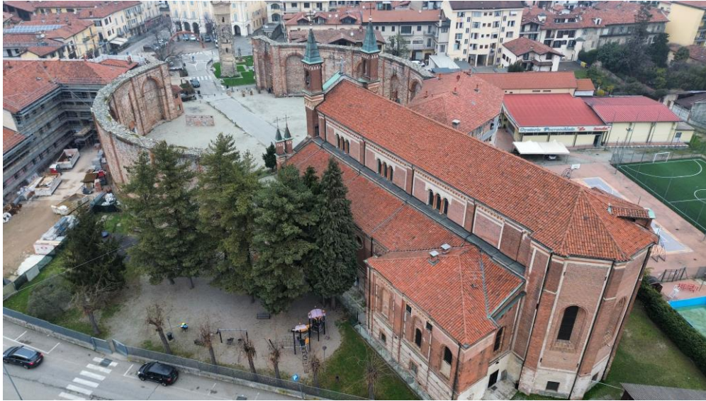
Foto n. 05. Vista aerea da sud ovest