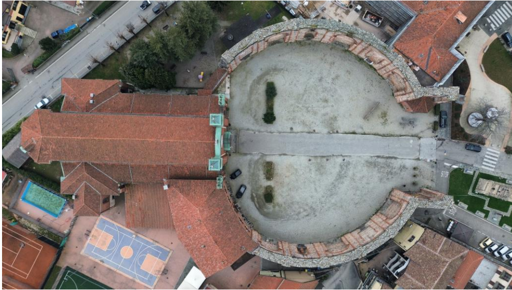
Foto n. 01. Foto aerea