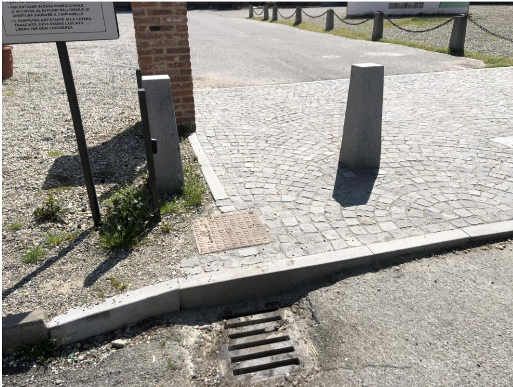
Foto n. 13. Dettaglio ingresso piazza