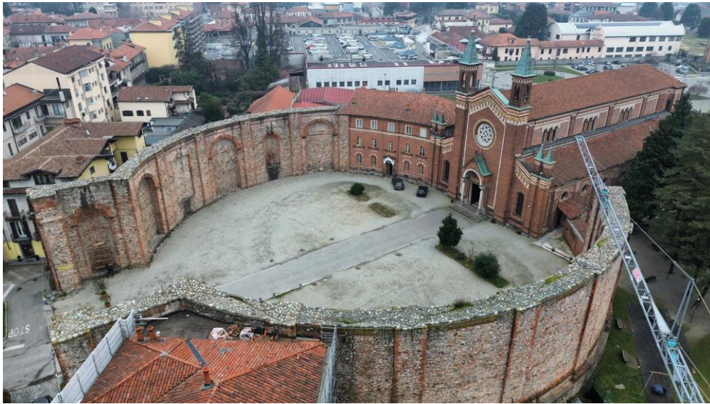
Foto n. 03. Vista aerea da ovest